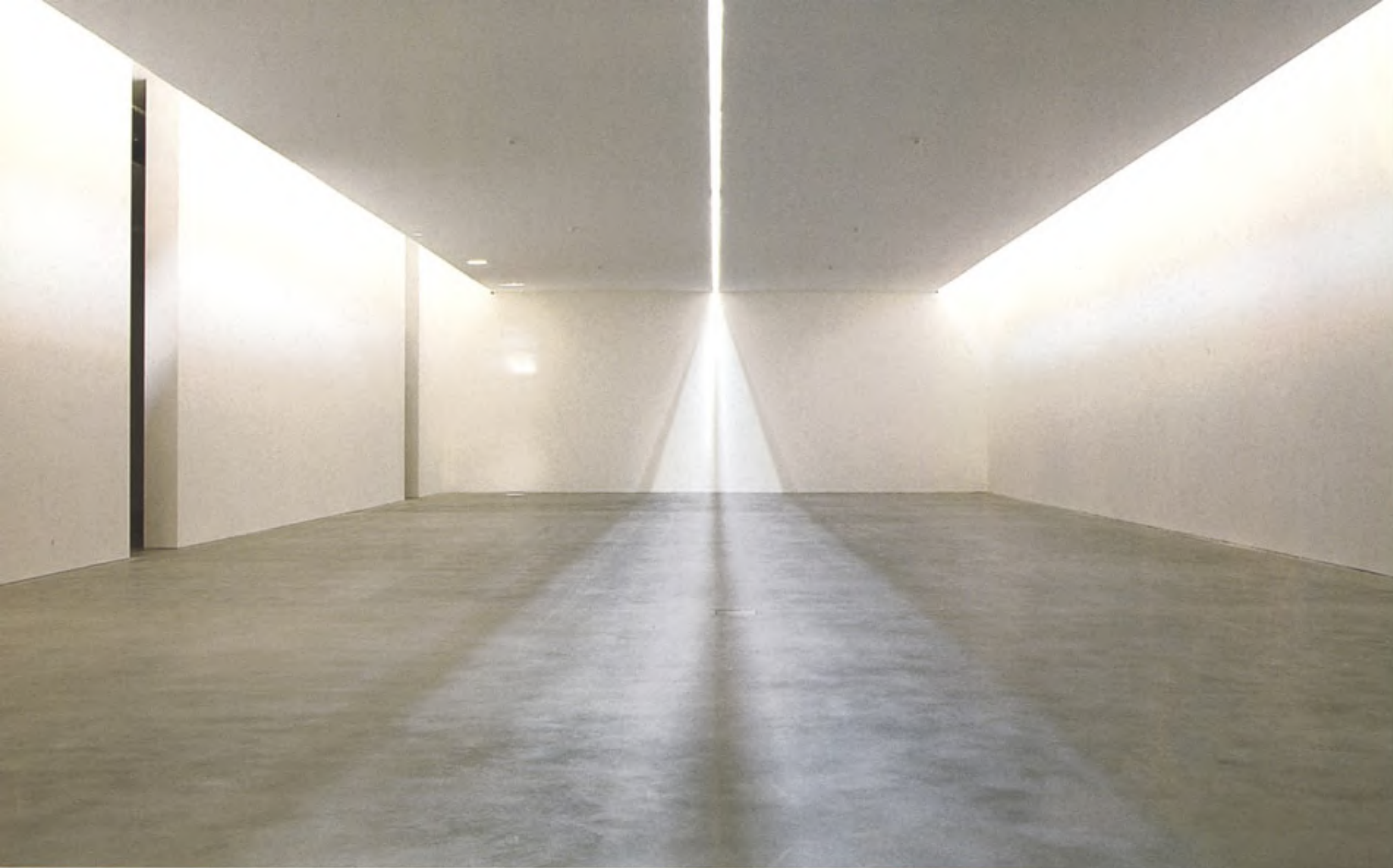
Une des salles d'exposition encore vide de la fondation Sandretto. Les jeux de lumière provenant des ouvertures très minces dessinent un ballet aérien, magnifique. CI-DESSOUS, une maquette en bois «I maestri», une œuvre d'Andrea Sala (2002); à gauche, «Relax» de Giuseppe Pietroniro (2002).